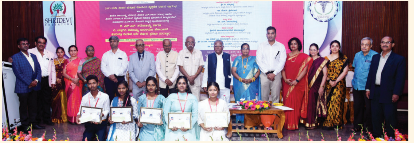
ಪ್ರತಿಭಾ ಪುರಸ್ಕಾರ ಪಡೆದ ವಿದ್ಯಾರ್ಥಿಗಳ ಜೊತೆ ಅತಿಥಿಗಳು.